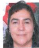
Dip. Ma. Concepción Navarrete Vital