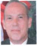
Dip. Genaro Carreño Muro